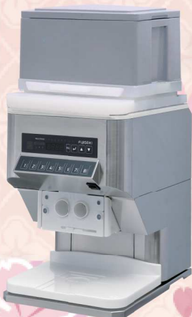
蓋無し段積み仕様