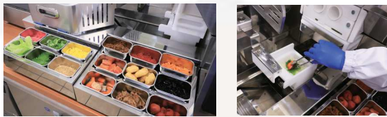
希望の具材を組み合わせたオリジナルおにぎりが成形可能