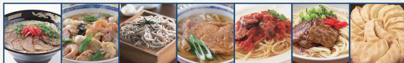
ラーメン 中華麺 そば うどん パスタ ソーキそば 餃子の皮