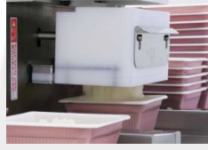
センサーが反応しご飯を一気に盛付