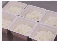
手ならし不要できれいに盛付