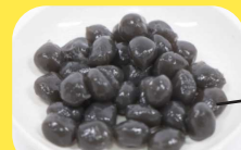
黒糖入りタピオカ